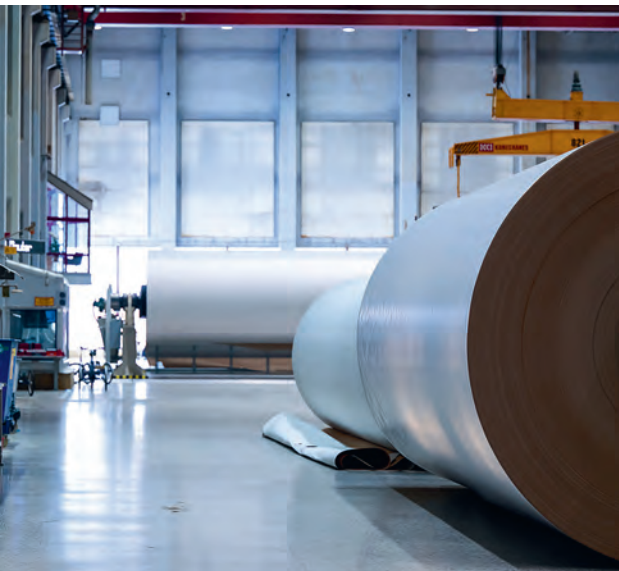
Syning av prov från kartongmaskinen. Tambur från maskinen i bakgrunden.

– Ökad kunskap är en nyckel här, och detta är en jätteviktig fråga för hela industrin och för oss när det gäller att vara en bra arbetsgivare. Det finns otroligt mycket kompetens som vi vill behålla och som vi på det här sättet ger bättre möjlighet att utvecklas – hela arbetslivet. 🌱